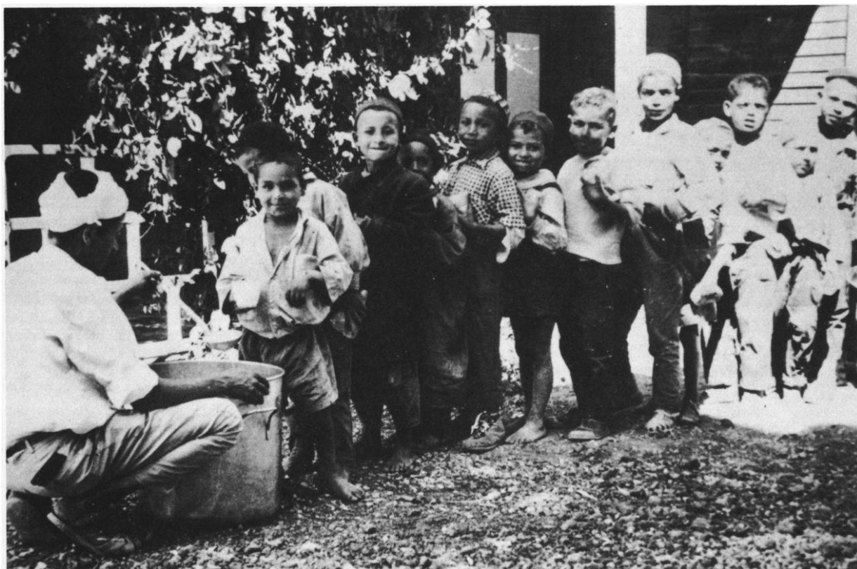
Centre Social de KHORBA. Distribution de lait.

39. Tillion, Germaine. "..." - Démocratie 60 (avril) 1960 ; article auquel sont empruntés les faits ci-dessus relatés.